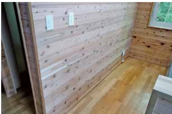
リフォーム工事 完了