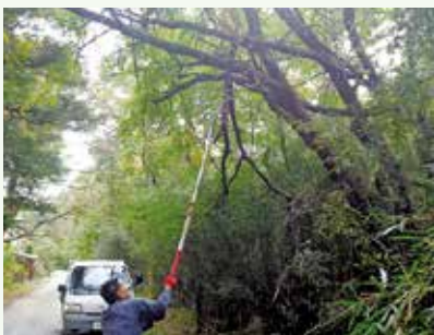
折れた枝処理 作業中 (景勝苑別荘地)