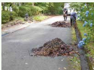
側溝清掃 作業中 (上の原高原別荘地)