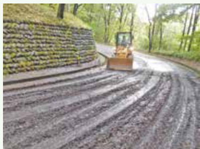
大雨後の道路清掃 作業中 (バケーションランド別荘地)