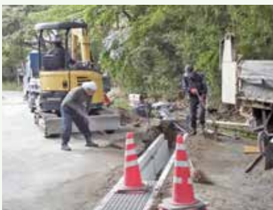
横断溝補修工事 作業中 (グレートハイランド別荘地)