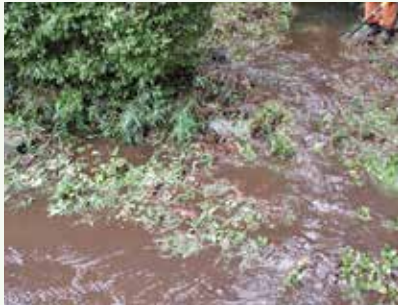
大雨後の側溝状況 (グレートハイランド別荘地)

那須高原においても9月中旬頃まで連日、大雨注意報が発令され、雷や強風・大雨の天候が続きました。当社では巡回や緊急パトロール、側溝清掃や道路清掃等を随時、実施しております。