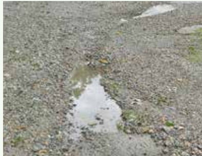
大雨で抉られた道路状況 (第2緑泉苑別荘地)