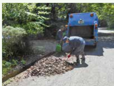
側溝清掃 作業中 (上の原高原別荘地)