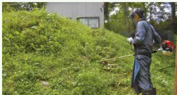
水道施設の草刈り 作業中 (グレートハイランド別荘地)