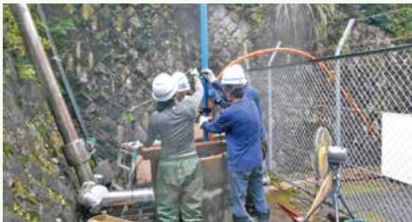
第1水源水中ポンプ交換工事 作業中 (レークサイド別荘地)

また、冬季期間は別荘からお帰りの際には凍結・破損による漏水事故を防ぐためにも、水道の元栓を閉めて頂けますようお願いいたします。また、大切な水資源の保全のためにも、更なる節水にご協力をお願いいたします。