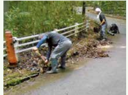
大雨後の側溝清掃 作業中 (吉野台別荘地)