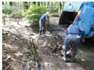
大雨後の側溝清掃 作業中 (バケーションランド別荘地)