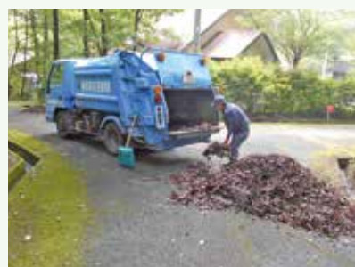
側溝清掃 作業中 (上の原高原別荘地)