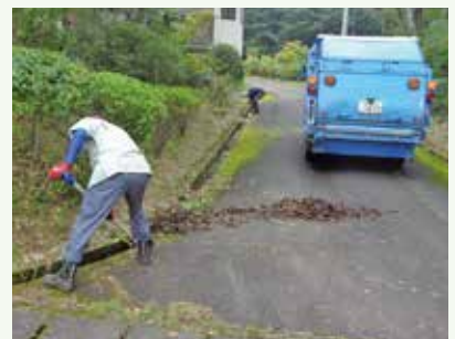
側溝清掃 作業中 (桜台別荘地)