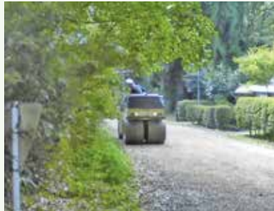
道路補修工事 作業中 (第2緑泉苑別荘地)