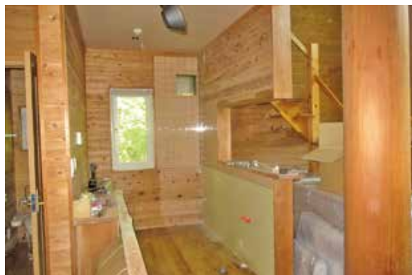
リフォーム工事 作業中