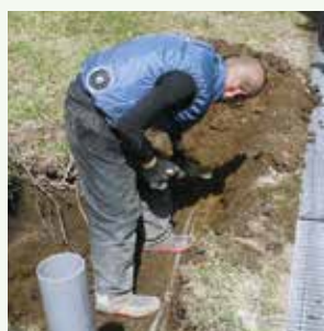
給水管漏水修理・維持管理