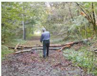
倒木処理 作業中 (湯の里村別荘地)