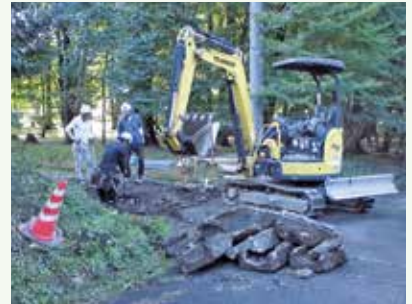
横断溝補修工事 作業中 (那珂川18期別荘地)