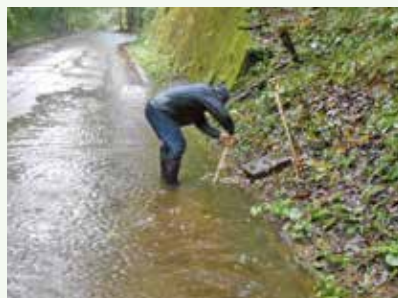
大雨後の側溝清掃 作業中 (バケーションランド別荘地)