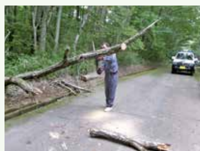
倒木処理 作業中 (バケーションランド別荘地)