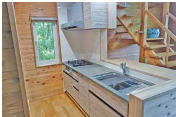
リフォーム工事 完了