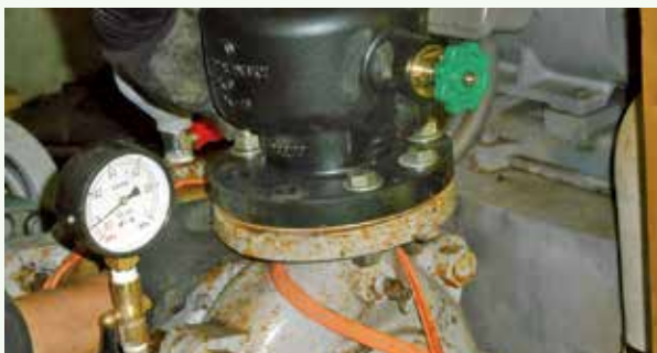
チャッキ弁交換工事 作業中 (吉野台別荘地)