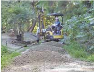
道路補修工事 作業中 (那珂川別荘地)