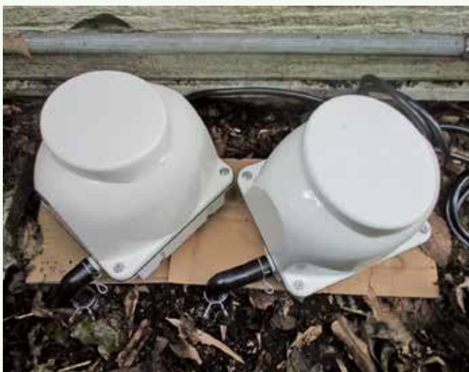
新しく設置されたブロー

浄化槽は内部で繁殖した微生物が生活排水を分解して浄化しておりますが、ブローから送られる空気で汚水を攪拌して浄化槽内を循環させながら、微生物に酸素を供給しておりますので、ブローは大変重要な働きをしております。