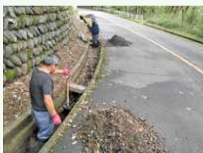
側溝清掃 作業中 (バケーションランド別荘地)