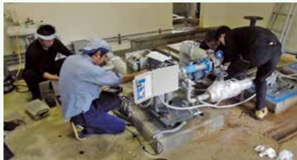
給水ポンプユニット交換工事 作業中 (レークサイド別荘地)