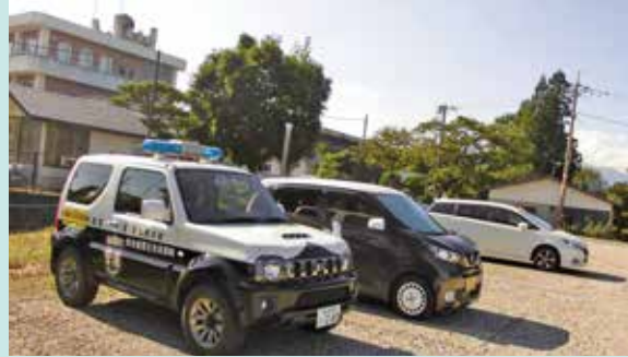
那須町立田代友愛小学校