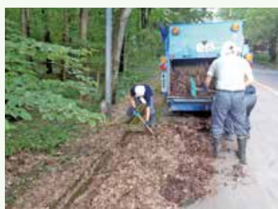
側溝清掃 作業中 (バケーションランド別荘地)