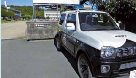
那須町立那須高原小学校