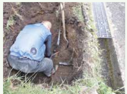
漏水修理工事 作業中 (レークサイド別荘地)