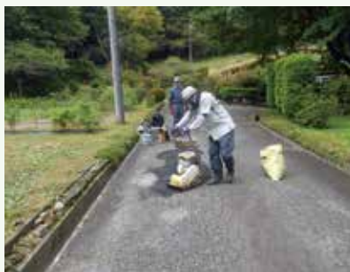
道路補修工事 作業中 (長南寺別荘地)